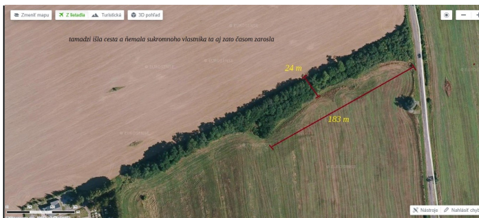
Obr. 2 Letecký pohľad na celý Korelaš v dĺžke 183 m od štátnej cesty na Transpetrol, v šírke približne 24 m.