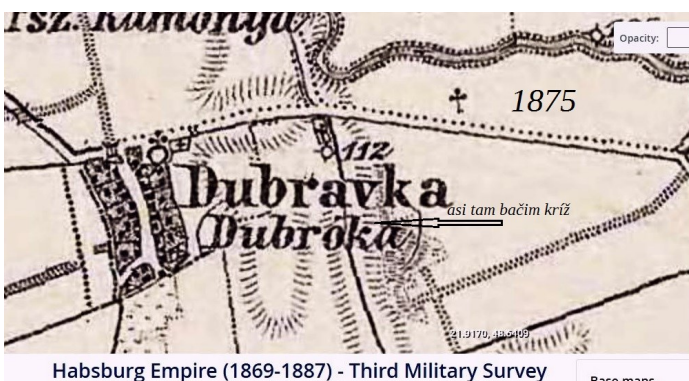
Obr. 1 Schematická mapa z roku 1875 ukazuje pod písmenom „a“ v slove Dubravka miesto označené krížom.