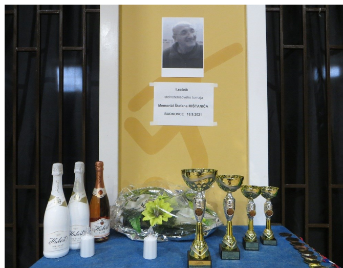
Foto: vecné ceny z turnaja Memoriál Štefana Mištaniča