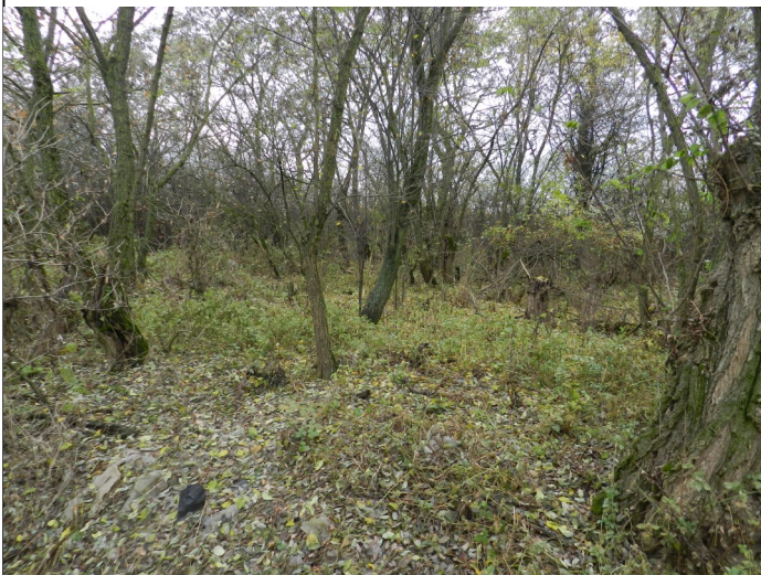
Obr. 3 Takto vyzerá zeleň na Korelaši v súčasnosti.